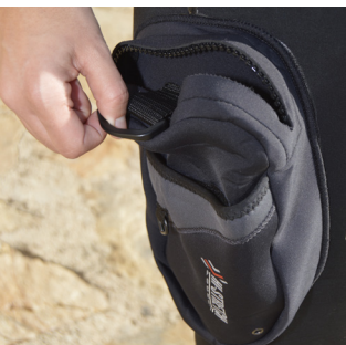
El bolsillo es grande y de fácil acceso.