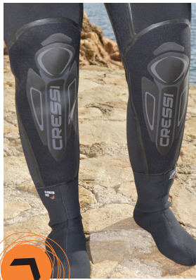
Protecciones elegantes y anti-abrasivas en las rodillas. Perfecta estanqueidad en las muñecas.

Disponibile en un amplio tallaje que va desde la XS a la XXXL, el Desert es un traje seco razonablemente ligero y resistente, en el que los acabados son más que perfectos. Confortable antes y después de la inmersión, rezuma prestancia en todos sus detalles. Definitivamente ideal para aquellos que aún siguen encontrando excusas como la incomodidad, excesivo volumen o dificultad de manejo de los secos para aferrarse al húmedo o al semisecco. ■