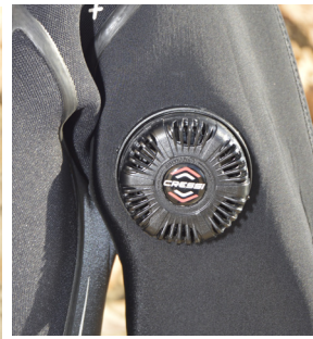
Detalle de la posición de la válvula de descarga.