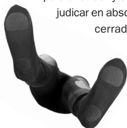
Los escaresines sin suela con protección especial antidesgaste.

El traje Desert cuenta con una sólida cremallera BDM en latón marino de 8 pitch, muy resistente y de fácil mantenimiento. Su apertura ofrece un espacio sobredimensionado para una fácil y cómoda colocación, sin perjudicar en absoluto la comodidad una vez cerrada. Una amplia solapa de neopreno la protege de cualquier rozamiento y alarga así en buena