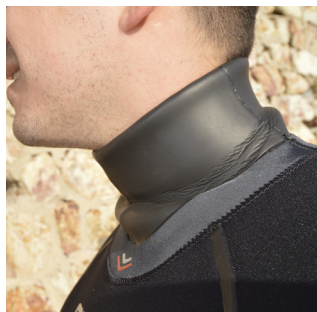
Sin opresiones en el cuello, cómoda movilidad.