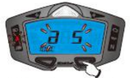
5. Réglage du voyant de température