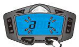
1. Unité de vitesse et de température