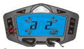
2. Réglage du voyant de vitesse