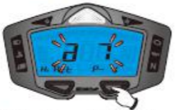
7. Type de signal et nombre de pistons