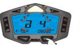
4. Réglage de la valeur du voyant de transmission jaune RPM et ON/OFF clignotant