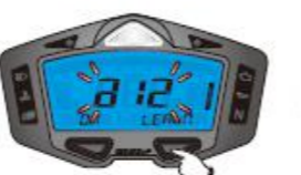
12. Indicateur de vitesse