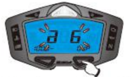
6. Circonférence et point de détection