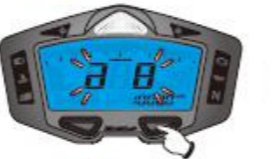
8. Plage RPM