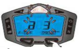
3. Réglage de la valeur du voyant de transmission rouge RPM et ON/OFF clignotant