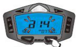
14. Réglage ODO externe

⚠ L'écran reviendra à l'écran principal après 30 secondes si aucun bouton n'est actionné.