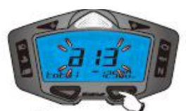
13. Ecran ODO interne