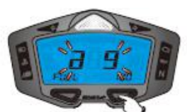
9. Résistance de jauge de carburant