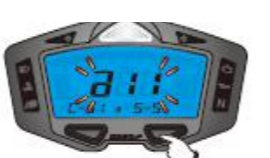
11. Couleurs et luminosité du rétroéclairage