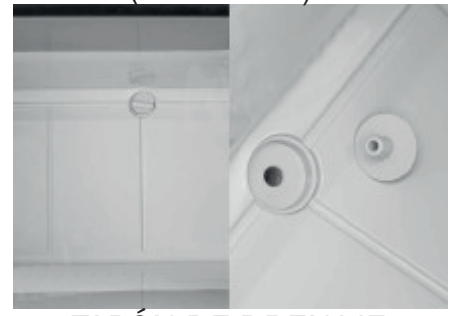
TAPÓN DE DRENAJE ANTIFUGAS