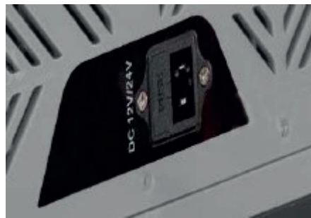
USO DUAL AC/DC