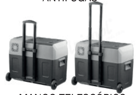
MANGO TELESCÓPICO FUERTE