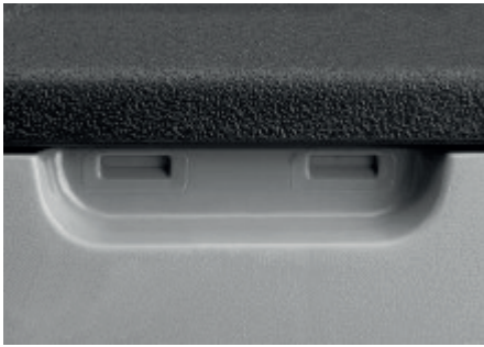
PESTILLO DE LA PUERTA